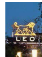
Современный логотип «ЛЕО Фарма» зарегистрирован в качестве официального товарного знака в 1956 г.

С 1949 по 1959 гг. «ЛЕО Фарма» перемещает производство в новую штаб-квартиру в г. Баллеруп, Дания и начинает экспорт фармацевтических препаратов.