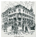
Здесь зародилась «ЛЕО Фарма».

В аптеке «ЛЕО» открываются бактериологическая и фармакофизиологическая лаборатории. В этих помещениях начинается производство стерильных и стандартизированных препаратов. Открыт ингаляторий для больных с респираторными заболеваниями.